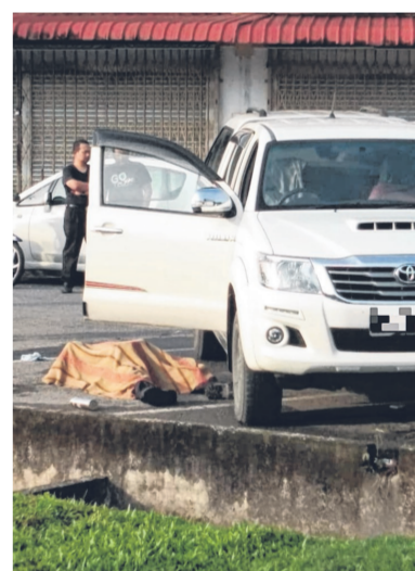
华族商人被狂捅多刀后，在卡车旁毙命。

据目击者说，事发时死者与嫌犯发生口角，嫌犯多次往死者身上捅刀，死者企图逃跑，却多