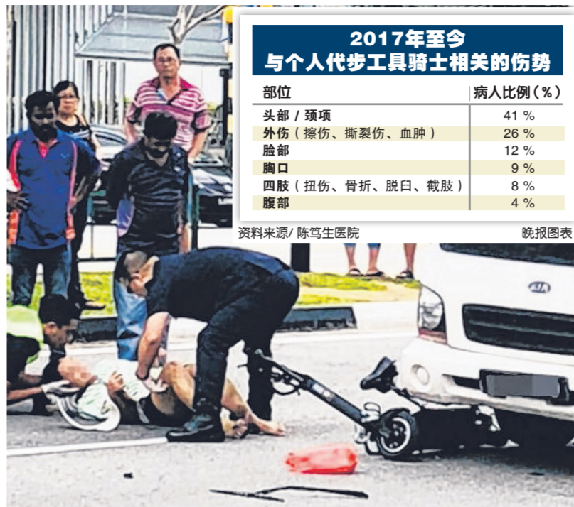
陈笃生医院的最新调查显示，涉及PMD的意外中，伤者多是头部或颈部受伤，占了四成。（档案照）

有鉴于上述数据，陈笃生医院认为有必要加强和提高公众对负责任且安全使用PMD的意识。