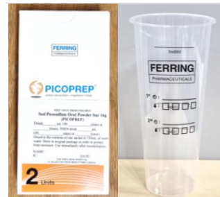
图 1. 一盒 PICOPREP 和测量杯