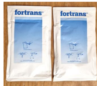
图 2. 两包 PEG 药粉